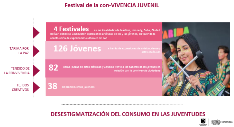
Gráfica 1. Resultados Festival de la con-VIVENCIA JUVENIL 2020-2023

Fuente: Presentación estrategia jóvenes. Secretaría de Seguridad, Convivencia y Justicia. Enero de 2024